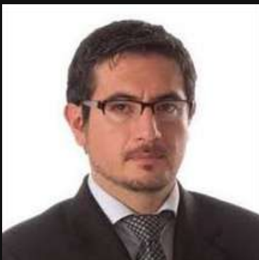
Dr. Bolívar Quito Betancourt

Para conocer más información del congreso ingresar a : https://beta.meet2go.com/ev/xxixcongresodelaacademiaiberoamericananeurologiapediatica