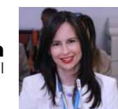
Karina Subía Asambleísta Nacional